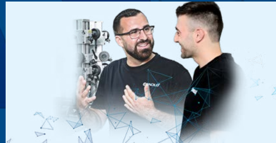
Future of Work